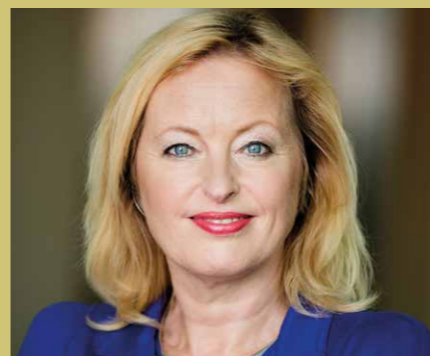
MINISTER BUSSEMAKER KOMT OOK.